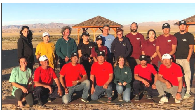
Les équipes KTT et TAKH rassemblées en Mongolie

Pour la première fois dans l'histoire de TAKH, l'équipe complète a pu se rendre sur le site de réintroduction des chevaux de Przewalski à Seer à l'occasion de l'inauguration du nouveau centre d'accueil écotouristique et scientifique de KTT au cœur du Parc national de Khomyn tal.