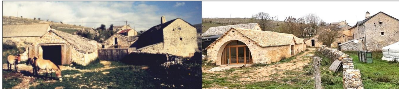
Evolution du hameau du Villaret de 1994 (à gauche) à 2022 (à droite)

En collaboration avec les architectes, un paysagiste, un scénographe et les artisans locaux, nous avons démarré des travaux très importants afin de rénover tous les bâtiments du Villaret.