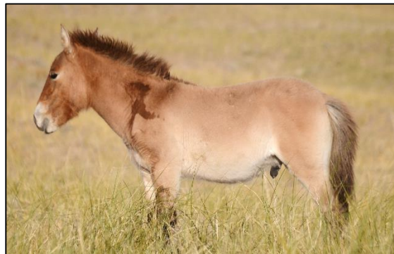
Delger, poulain d'Atuin 2021, porte sur l'épaule la marque de son père Odoo et de son grand-père Diabelli

En 2022, la population de chevaux à Seer est passée de 121 à 141 chevaux avec 25 naissances au total, dont 20 poulains vivants. Les groupes de Sarni Gerel , Bidert , Odoo , Atlas , Yol , Urgamal , Higgs et Jonkhor sont stables depuis plusieurs mois ou années, tandis que 5 à 6 autres groupes sont encore instables, car en formation. En effet, une trentaine de jeunes étalons gravite autour des groupes, et cherche à fonder leur propre famille, avec plus ou moins de succès selon les individus.