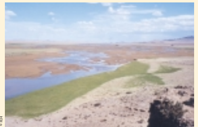
Vue de la rivière Zavkhan-Gol : Ses rives enherbées assureront chaque année une nourriture abondante aux chevaux de Przewalski réintroduits, notamment durant la saison de reproduction.

L'Association TAKH a signé un accord avec le gouvernement local qui lui octroie les droits de pâturage exclusif sur un site d'une surface de 130 km 2 pendant 30 ans dans Khomiin Tal. TAKH a financé en contrepartie la rénovation d'anciens puits. Ce site, qui accueillera les chevaux de Przewalski réintroduits, doit être clôturé en 2003. Ceci permettra à une végétation riche de se développer avant l'arrivée des animaux. Cette exclusivité préviendra également les risques d'hybridation avec les chevaux domestiques, omniprésents en Mongolie. A terme, les activités d'élevage de Khomiin Tal seront gérées afin de préserver la ressource en herbe et contrôler les étalons reproducteurs domestiques. La région dans sa totalité sera alors apte à accueillir une population complètement libre d'environ 1500 chevaux de Przewalski.