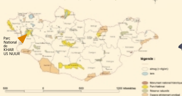
Espaces protégés de Mongolie

Les lois mongoles sur l'environnement définissent quatre différents statuts de protection :